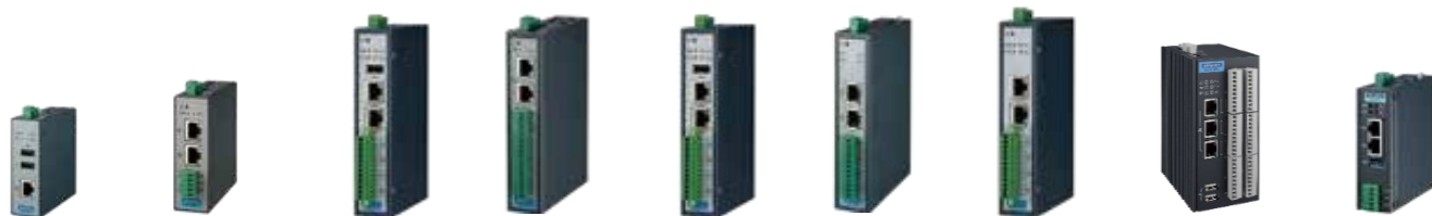
ECU-1050 ECU-1051 ECU-1251 ECU-1251D ECU-1251V2 ECU-1252 ECU-1260 ECU-1370 ECU-150

Yocto/EdgeLink版、ubuntu版の2種類の展開で、お客様の要求に応じた開発の条件で通信ゲートウェイを実現します