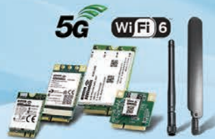
ワイヤレスモジュール