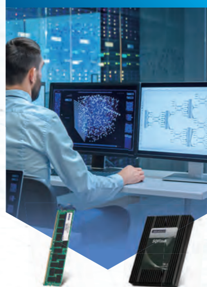
SQR-RD4N SQR-CU2 ER-1