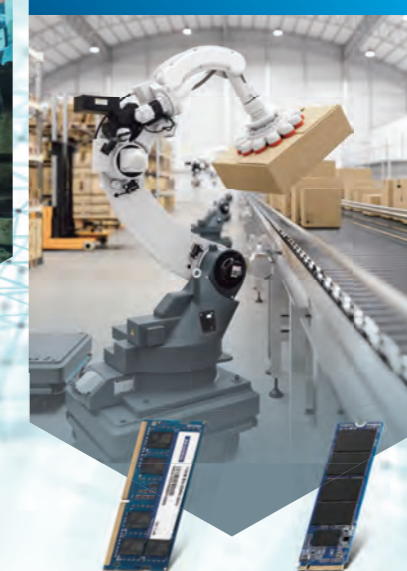
SQR-SD4N SQF-C8M 720